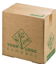
Foodmailer® Eco personnalisé